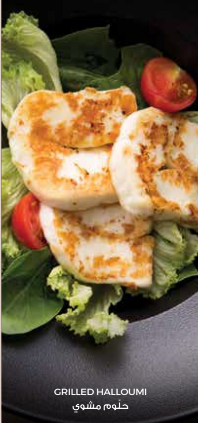
GRILLED HALLOUMI حلّوم مشوي