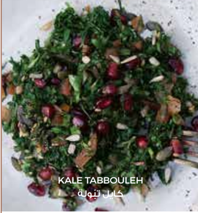
KALE TABBOULEH كايلا تَبُولَة