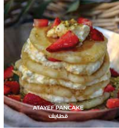
ATAYEF PANCAKE قطايف