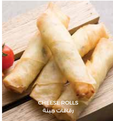
CHEESE ROLLS رقاقات جبنة