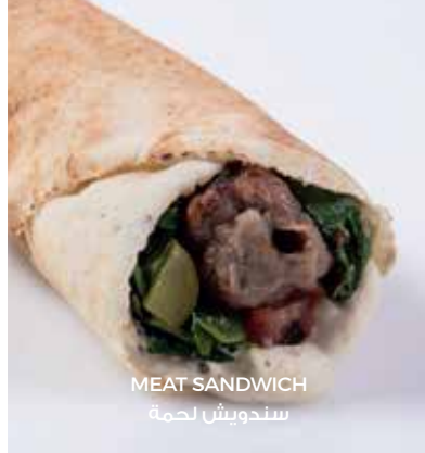
MEAT SANDWICH سندويش لحمة