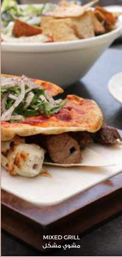
MIXED GRILL مشوي مشكل