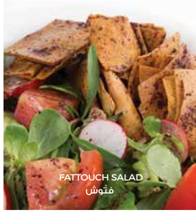
FATTOUCH SALAD فَتُوش