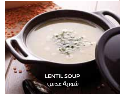
LENTIL SOUP شوربة عدس