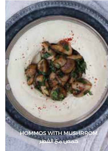
HOMMOS WITH MUSHROOM حمص مع الفطر